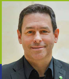
Arndt Klocke (Bündnis 90/ Die Grünen, MdL)