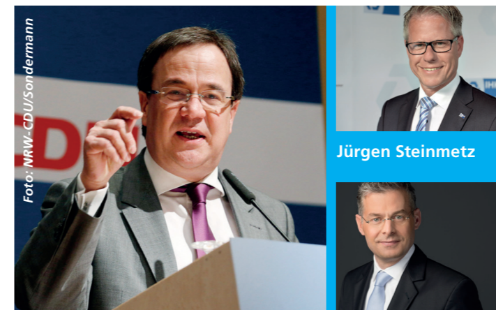
Armin Laschet (CDU)

Sound Orchester Burgthann Medley „Fluch der Karibik / Zurück in die Zukunft“